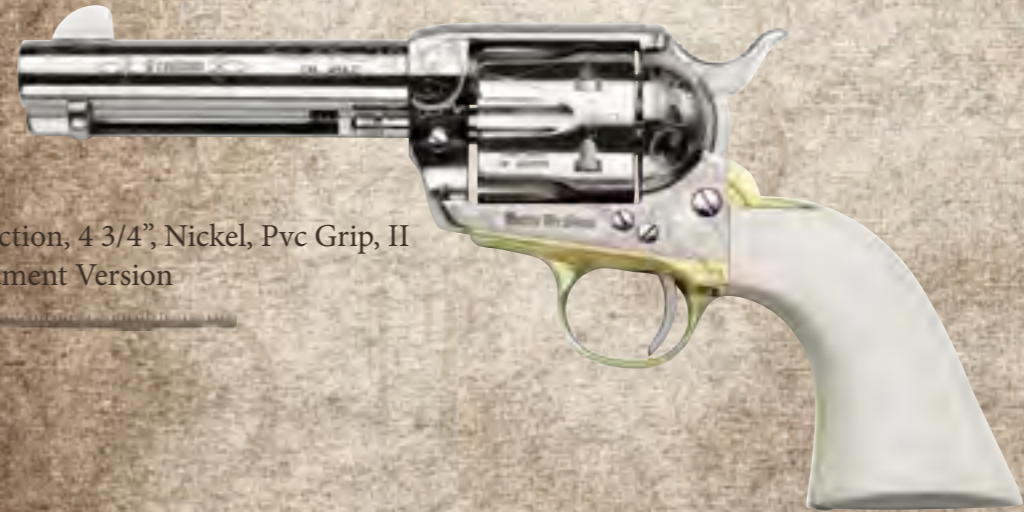
78) Single Action, 4 3/4", Nickel, Pvc Grip, II Amendment Version