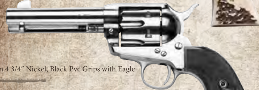
64) Single Action 4 3/4" Nickel, Black Pvc Grips with Eagle