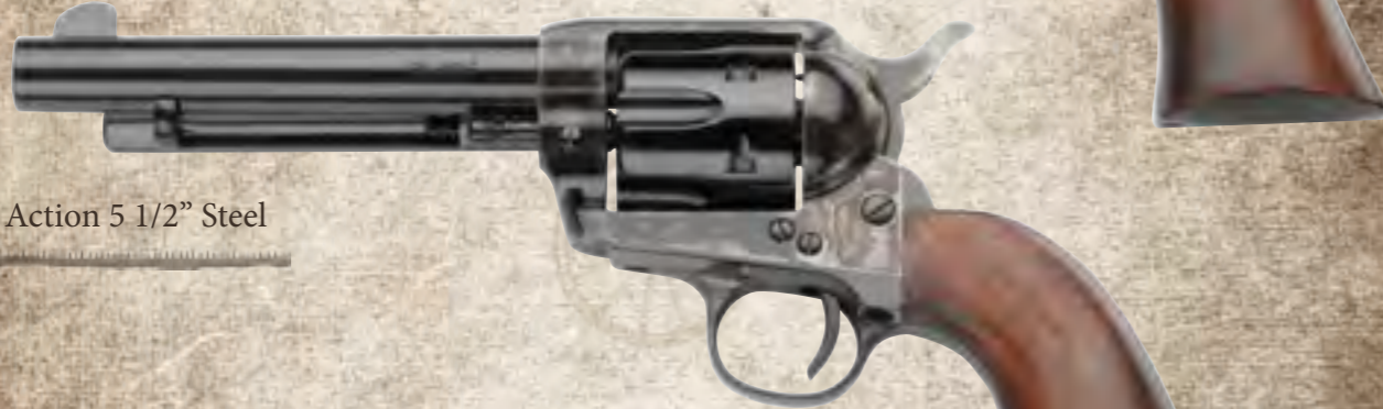
60) Single Action 5 1/2" Steel