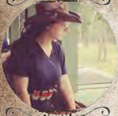
Diamond Kate SASS*95104