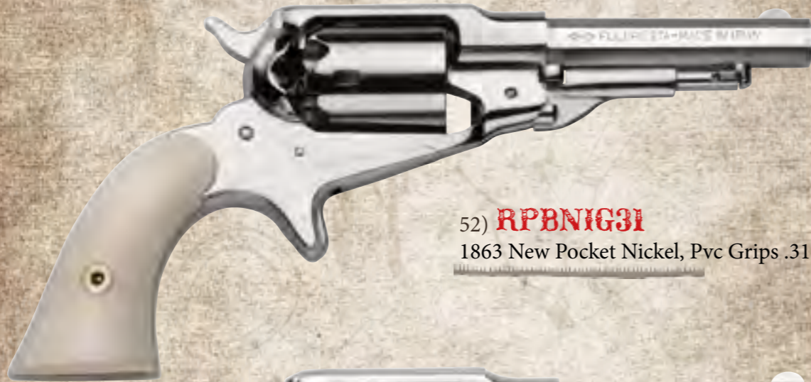
52) RPBNG31 1863 New Pocket Nickel, Pvc Grips .31