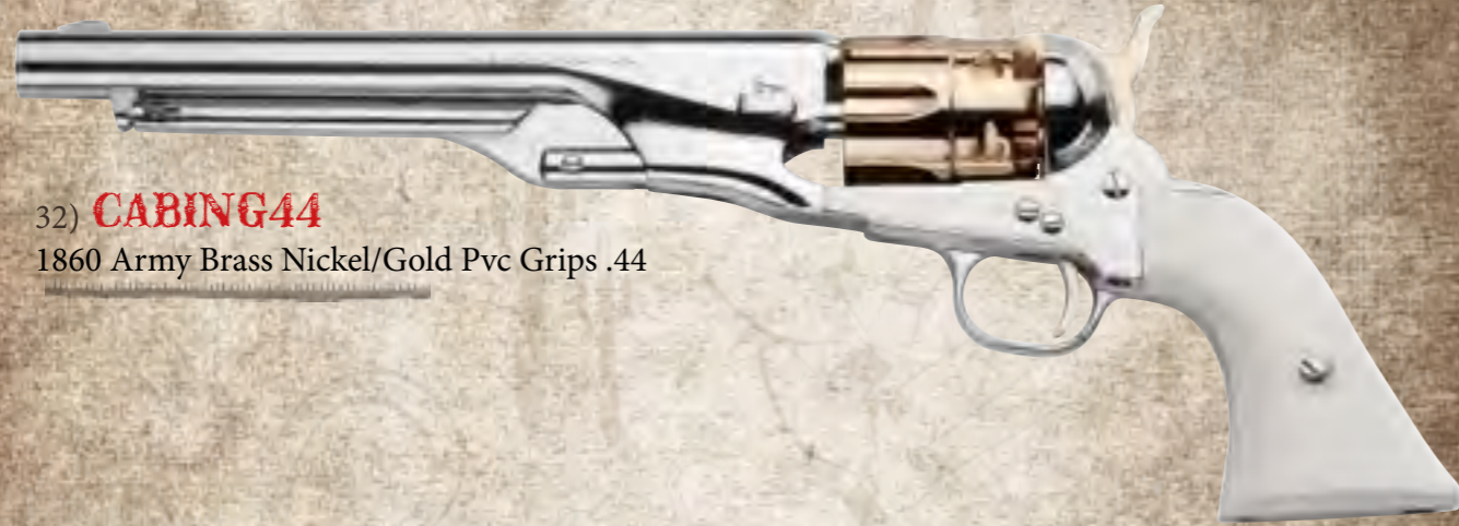
32) CABING44 1860 Army Brass Nickel/Gold Pvc Grips .44