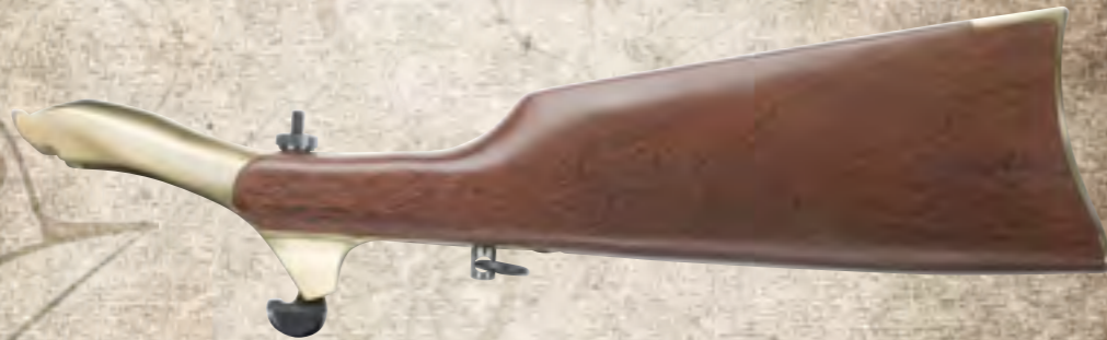
57) ASS44 Army Shoulder Stock