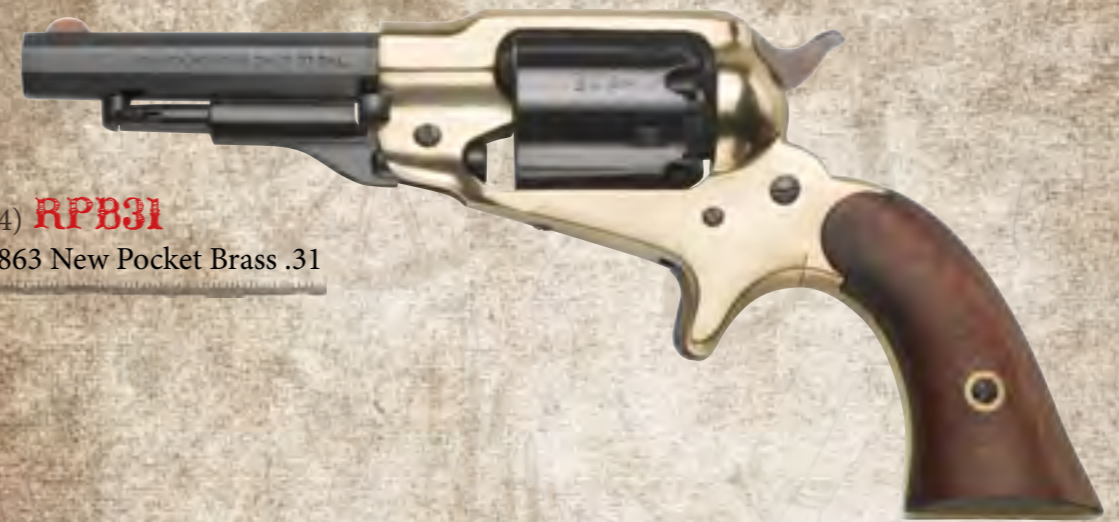
54) RPB31 1863 New Pocket Brass .31

Approx. 25,000 pieces were produced in three different version between 1863 and 1873. First type featured a brass frame and triggerguard. The second, identical in size and in mechanism to the first, featured a steel frame and a brass triggerguard. The third, and last of the series, was completely made of steel. The Pocket revolver is now available in all versions featuring walnut grips, case hardened hammer and trigger and blued octagonal barrel. Available also in nickel plated version and engraved version.