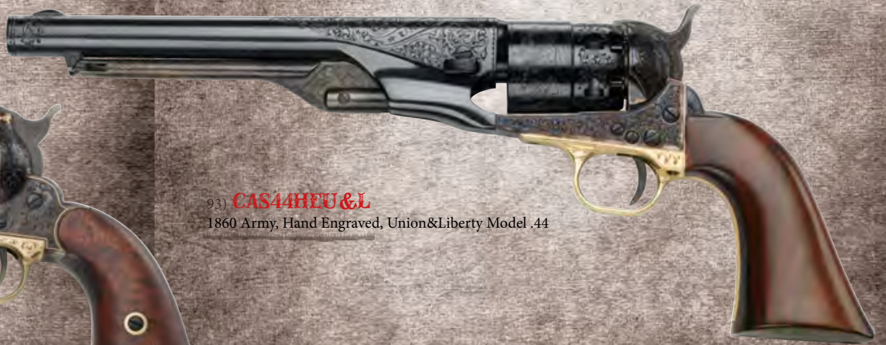
93) CAS44HEU&L 1860 Army, Hand Engraved, Union&Liberty Model .44