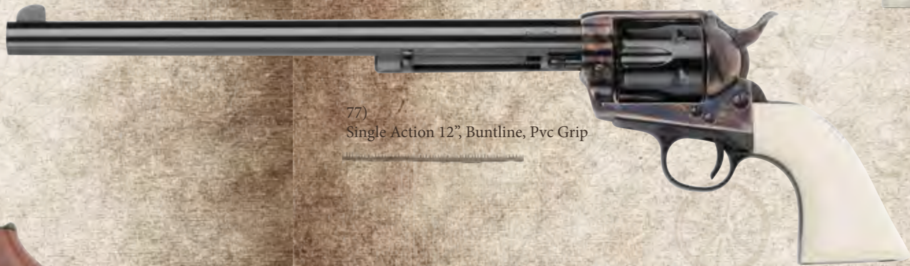
77) Single Action 12", Buntline, Pvc Grip