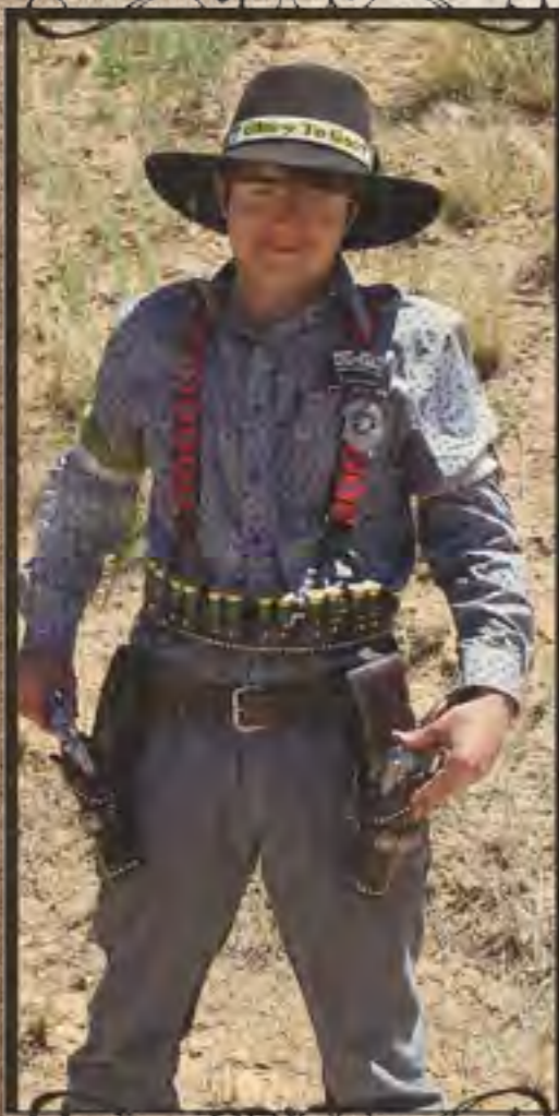
Preacher Kid. SASS*92048