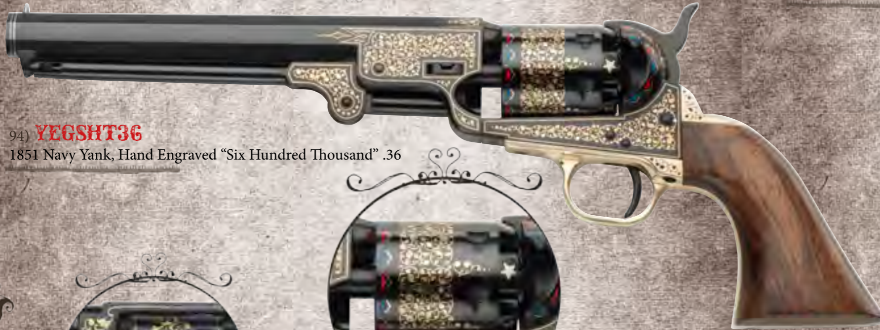
94) YEGSHT36 1851 Navy Yank, Hand Engraved "Six Hundred Thousand" .36