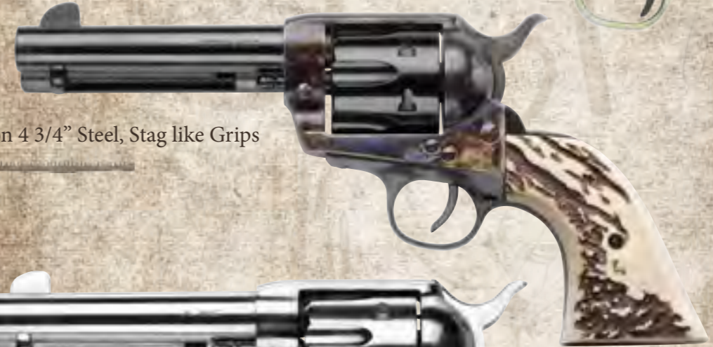
63) Single Action 4 3/4" Steel, Stag like Grips