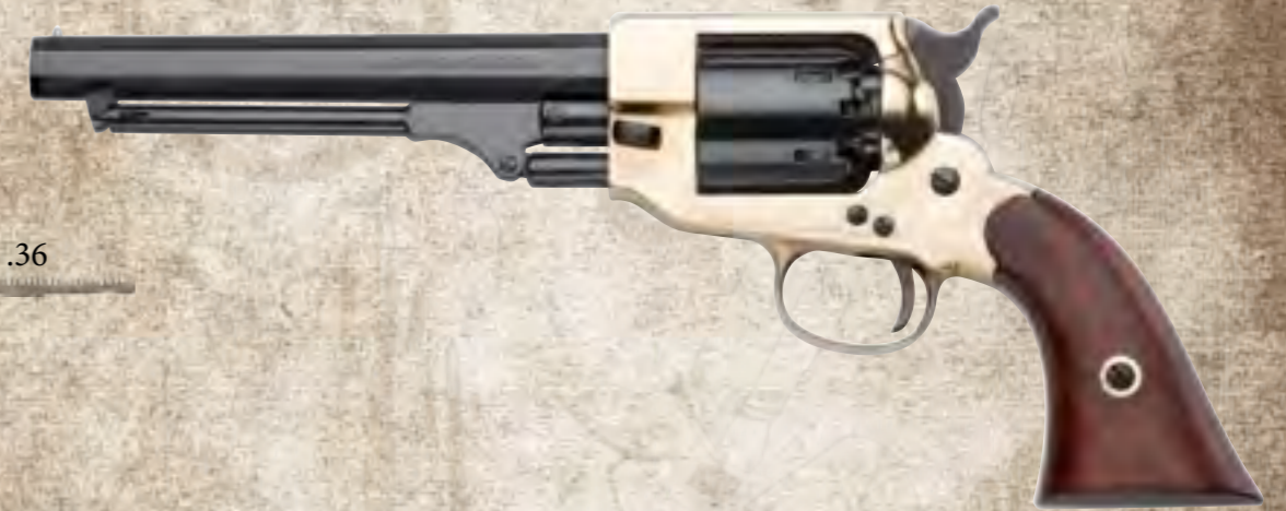
3) SPB36 1862 Spiller&Burr .36