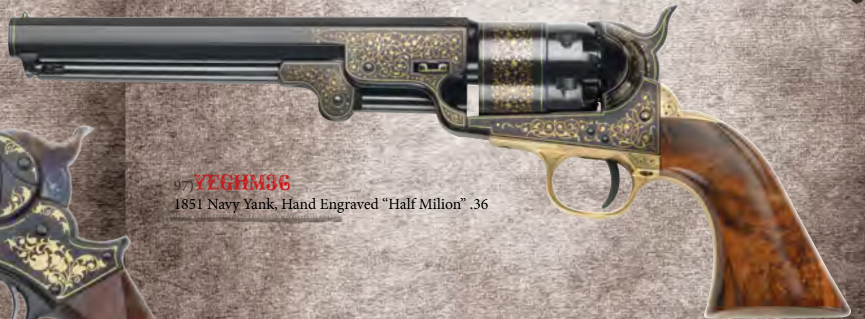
97) YEGHM36 1851 Navy Yank, Hand Engraved "Half Milion" .36