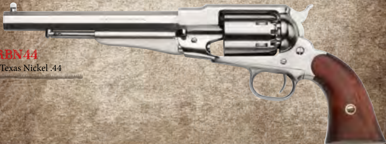
47) RBN44 1858 Texas Nickel .44