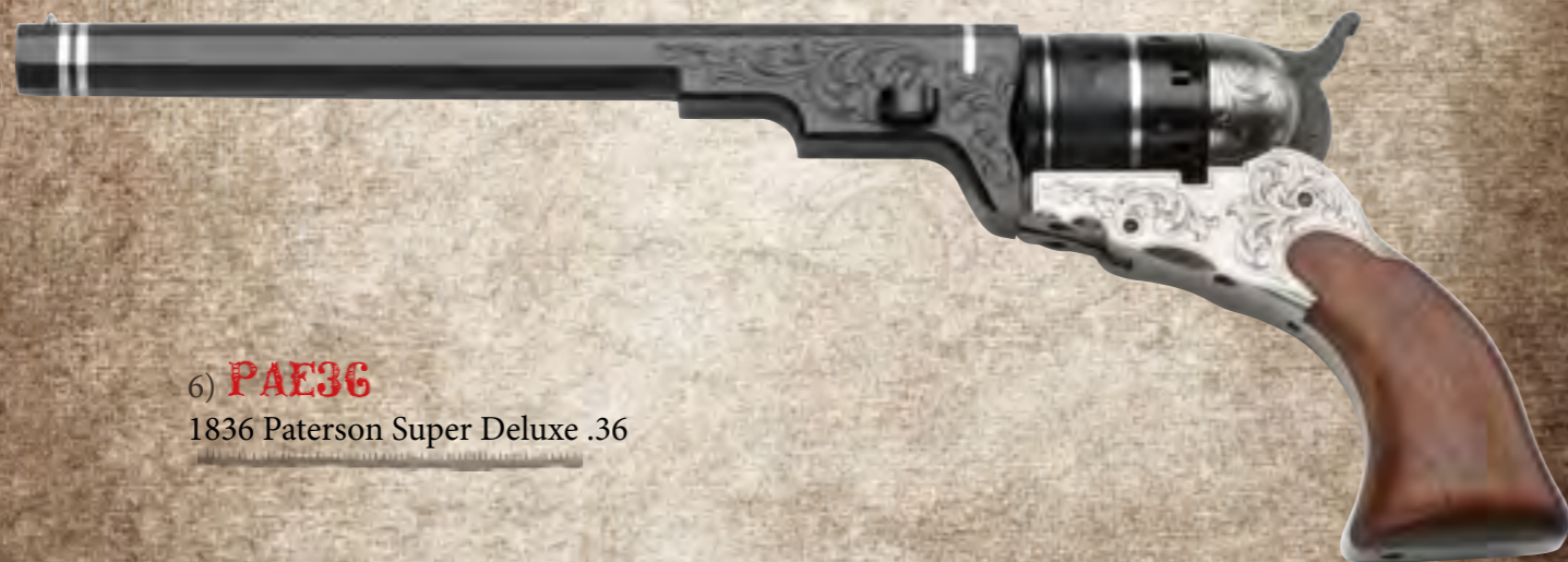
6) PAE36 1836 Paterson Super Deluxe .36