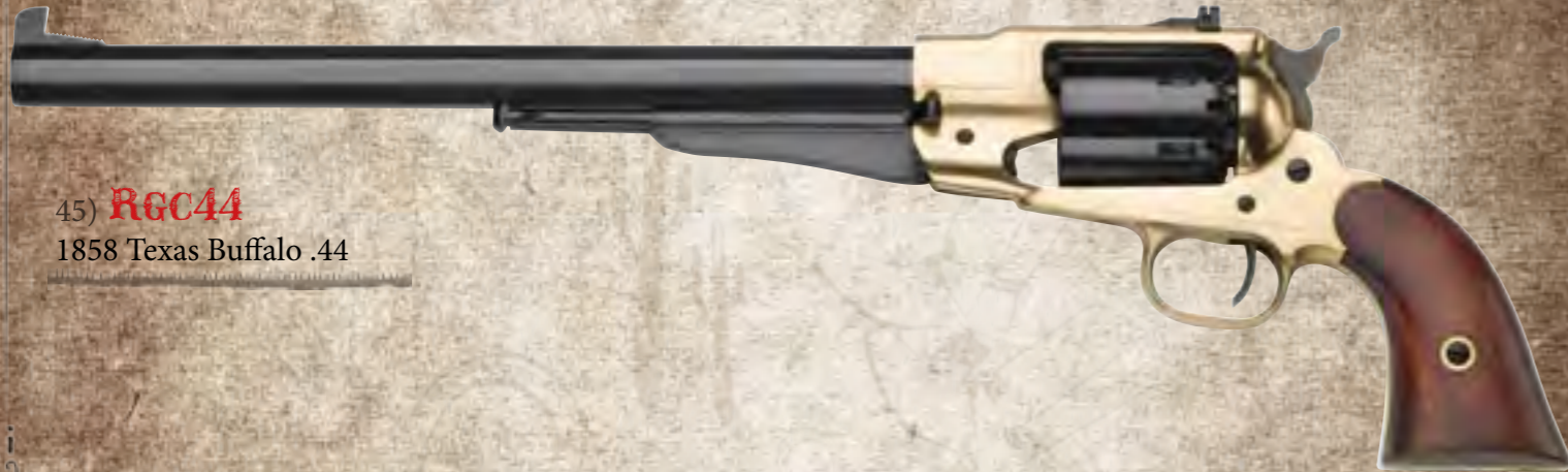
45) RGC44 1858 Texas Buffalo .44