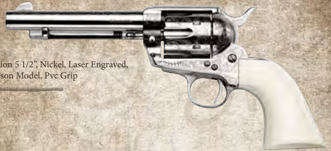
76) Single Action 5 1/2", Nickel, Laser Engraved, BatMasterson Model, Pvc Grip