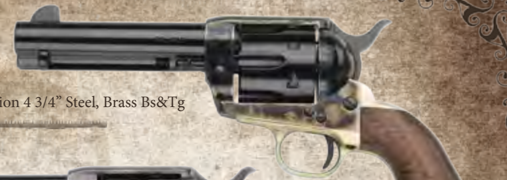
62) Single Action 4 3/4" Steel, Brass Bs&Tg

Dopo un attento studio e un utilizzo massiccio delle nostre risorse umane, quest'arma, a detta di esperti americani a cui è stata sottoposta, risulta essere la migliore e la più adatta a rispondere alle richieste dei moderni cowboy: affidabilità nel tempo, intercambiabilità con le originali del vecchio west, viene da noi prodotta utilizzando le migliori tecnologie e i migliori materiali disponibili al momento. Ogni revolver prodotto viene curato e verificato da personale esperto; disponibile nelle tre lunghezze di canne classiche ( 4 3/4", 5 1/2", 7 1/2" ), nei calibri .45LC, .357 Mag, .44/40W, tartarugata, nickelata o in acciaio inossidabile con guance in noce europeo lucidate a olio o in finto avorio, queste alcune delle caratteristiche di questa nostra '73.