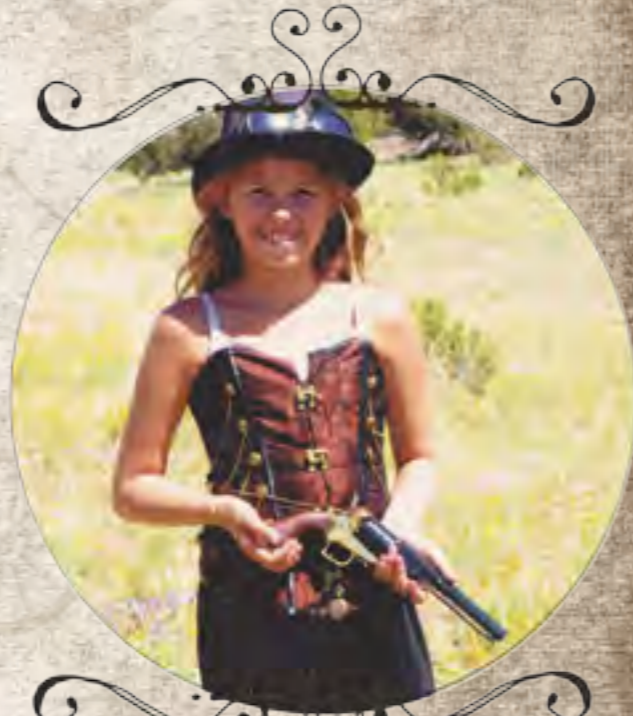
Kota Khaos SASS*94378