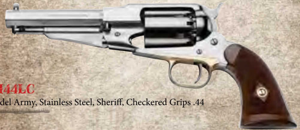
51) RGSSH44LC 1858 New Model Army, Stainless Steel, Sheriff, Checkered Grips .44