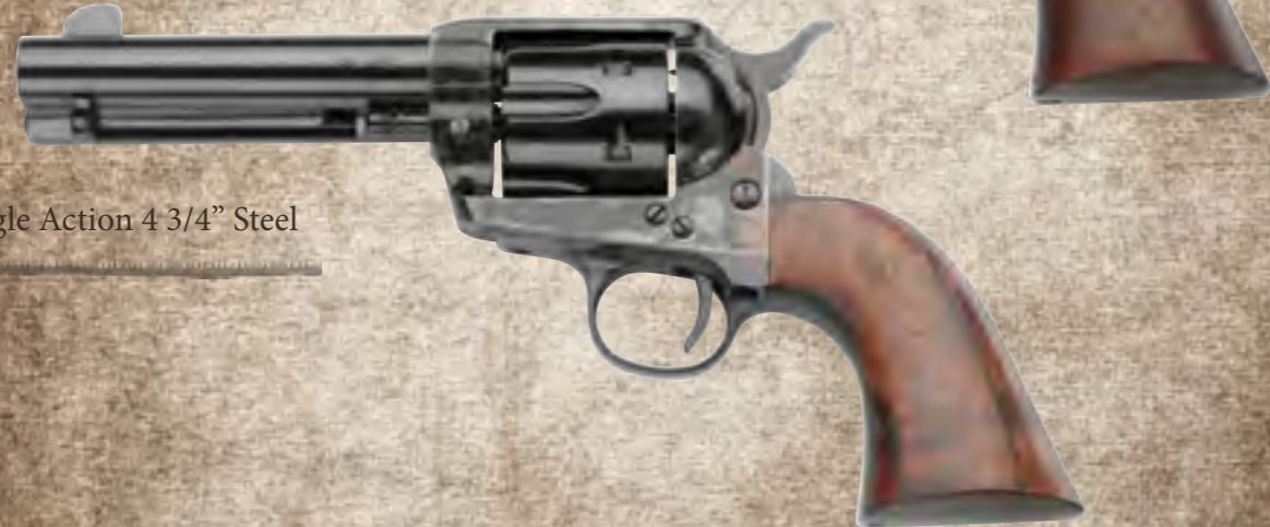
61) Single Action 4 3/4" Steel