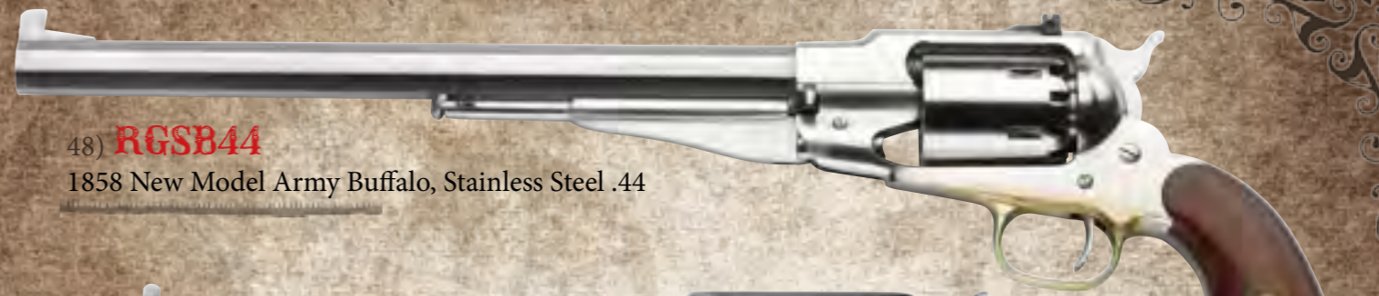
48) RGSB44 1858 New Model Army Buffalo, Stainless Steel .44