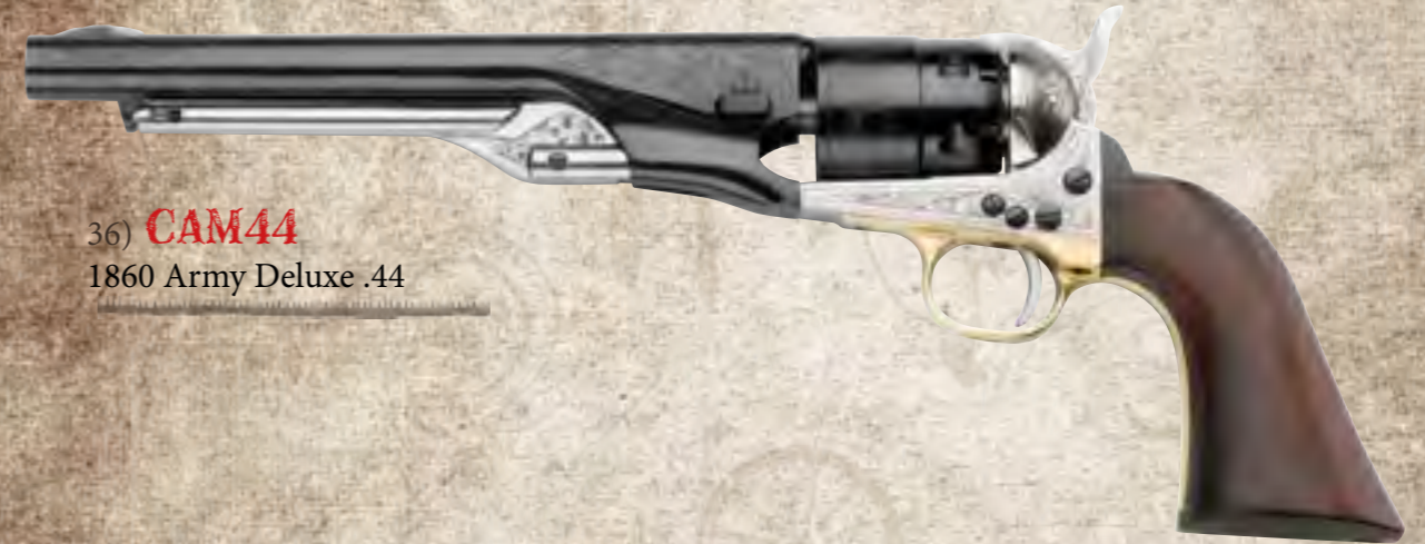
36) CAM44 1860 Army Deluxe .44