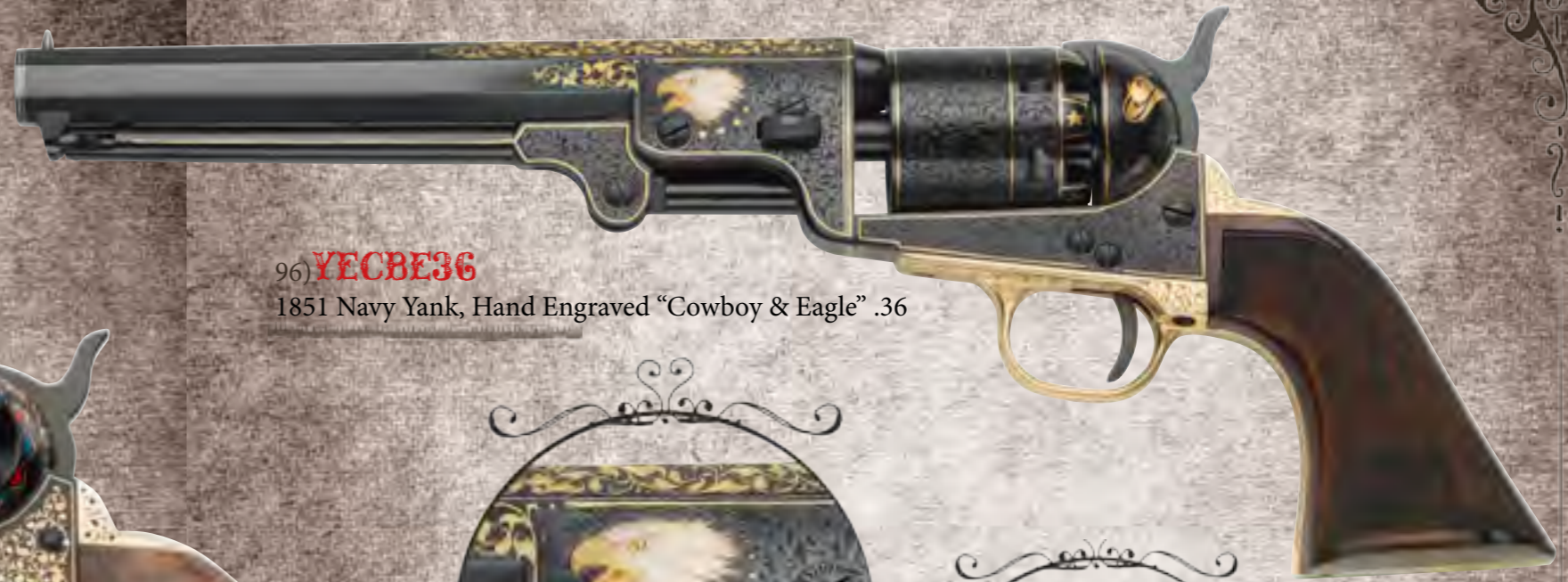
96) YECBE36 1851 Navy Yank, Hand Engraved "Cowboy & Eagle" .36