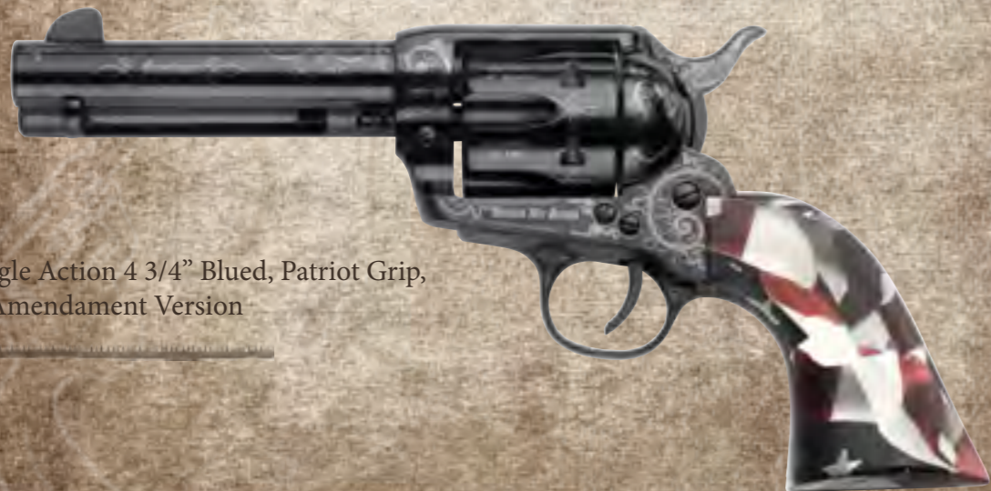
75) Single Action 4 3/4" Blued, Patriot Grip, II Amendment Version