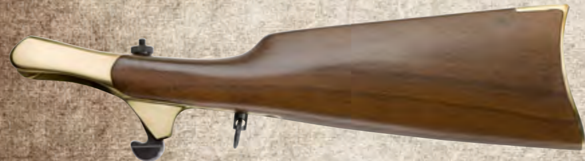
58) NSS44 Navy Shoulder Stock

Nel periodo detto di "transizione", subito dopo la fine delle Guerra di Secessione, nacquero molti modelli di armi che, in varia misura, svolsero un ruolo importante nella stesura della storia americana. Una tra queste armi fu proprio la carabina Smith: molti furono i pionieri che attraversavano la frontiera armati della loro fidata carabina. La bascula incernierata permetteva una ricarica semplice e veloce persino da cavallo. La riproduzione della carabina Smith è disponibile in versione CAVALRY cl. 50, con ponticello e anello-sella, ARTILLERY, con maglietta porta-cinghia, e finemente incisa a mano.