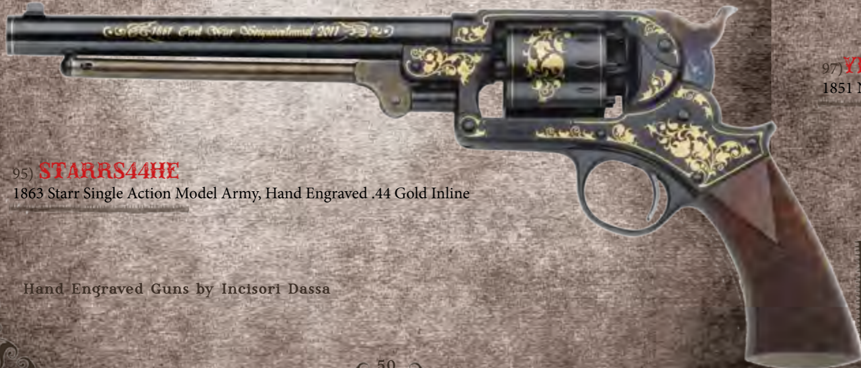
95) STARRS44HE 1863 Starr Single Action Model Army, Hand Engraved .44 Gold Inline