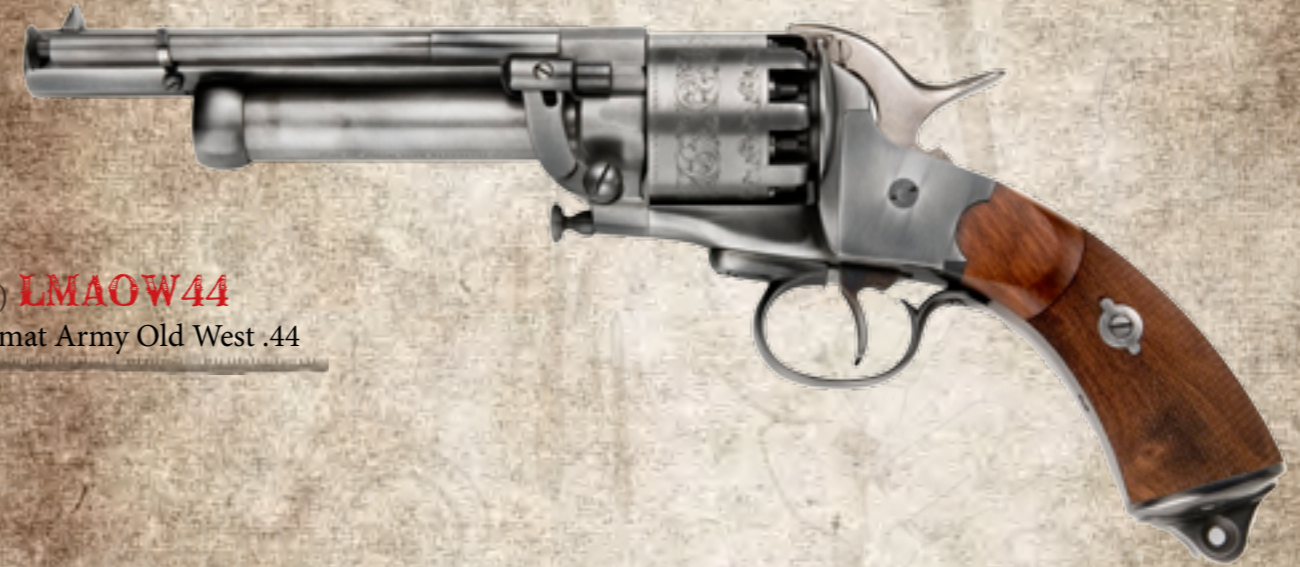
11) LMAOW44 Lemat Army Old West .44