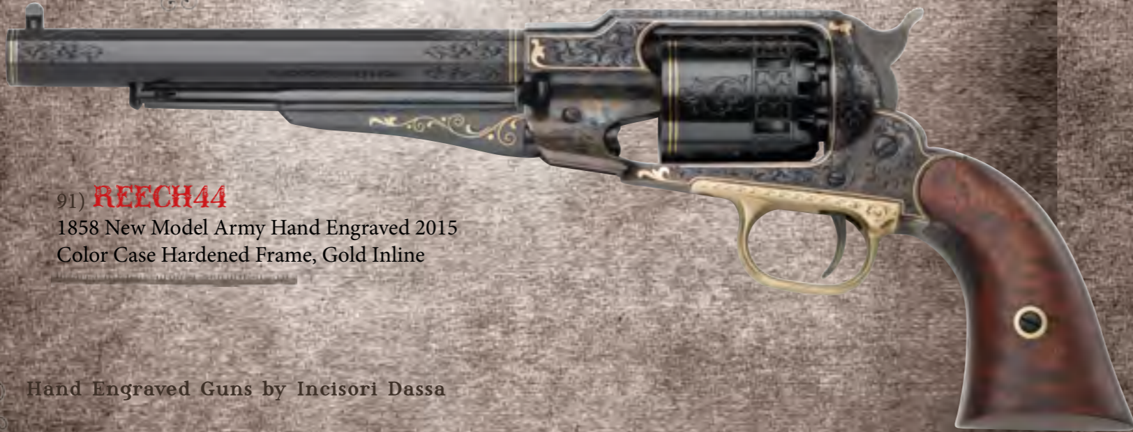
91) REECH44 1858 New Model Army Hand Engraved 2015 Color Case Hardened Frame, Gold Inline