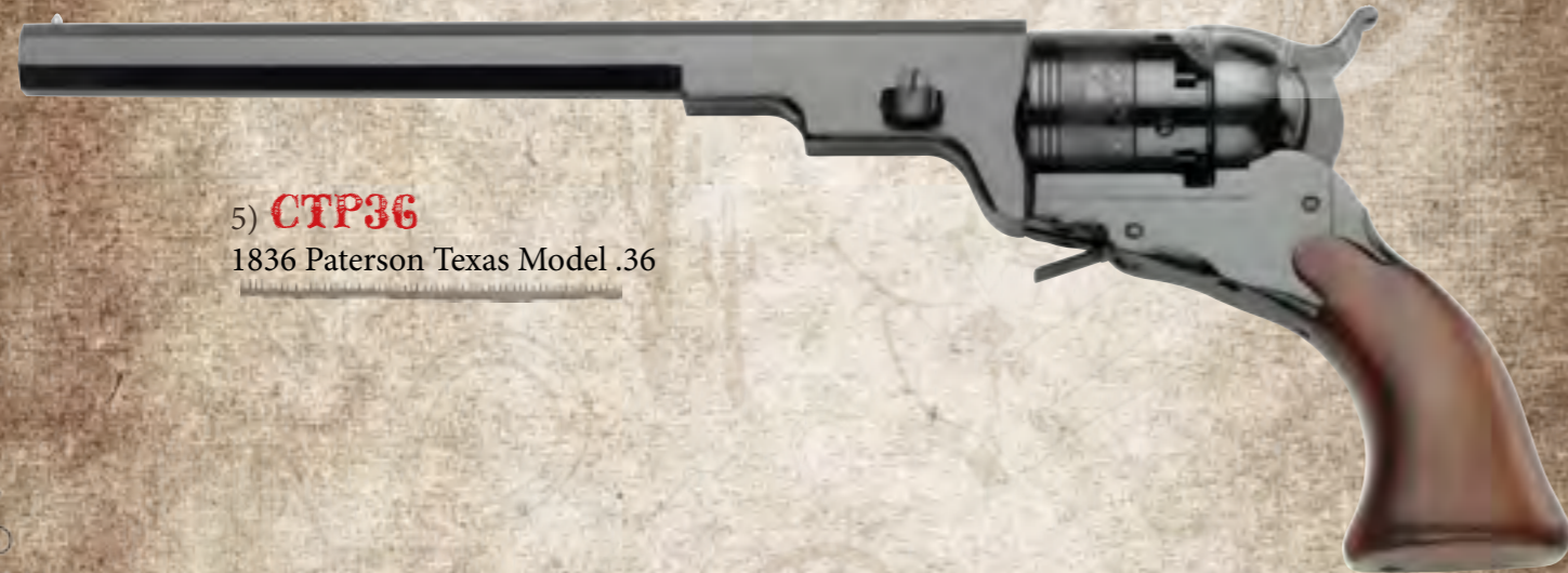
5) CTP36 1836 Paterson Texas Model .36