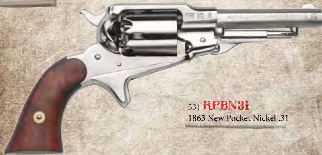
53) RPB31 1863 New Pocket Nickel .31

Costruita dal 1863 al 1873, ne furono prodotti 25.000 esemplari, suddivisi in tre versioni. Il primo tipo aveva bascula e sottoguardia in ottone. Il secondo, identico nelle dimensioni e nel meccanismo al primo, aveva bascula in acciaio e sottoguardia in ottone. Il terzo, ed ultimo della serie, era completamente in acciaio. Quest'arma è disponibile, in tutte le versioni, con quancine in noce, cane e grilletto tartarugati, canna ottagonale e particolari bruniti. Disponibile anche in versione nichelata o incisa.