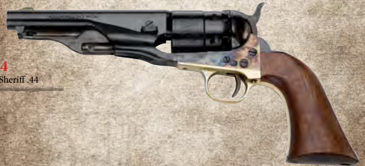
37) CSA44 1860 Army Sheriff .44