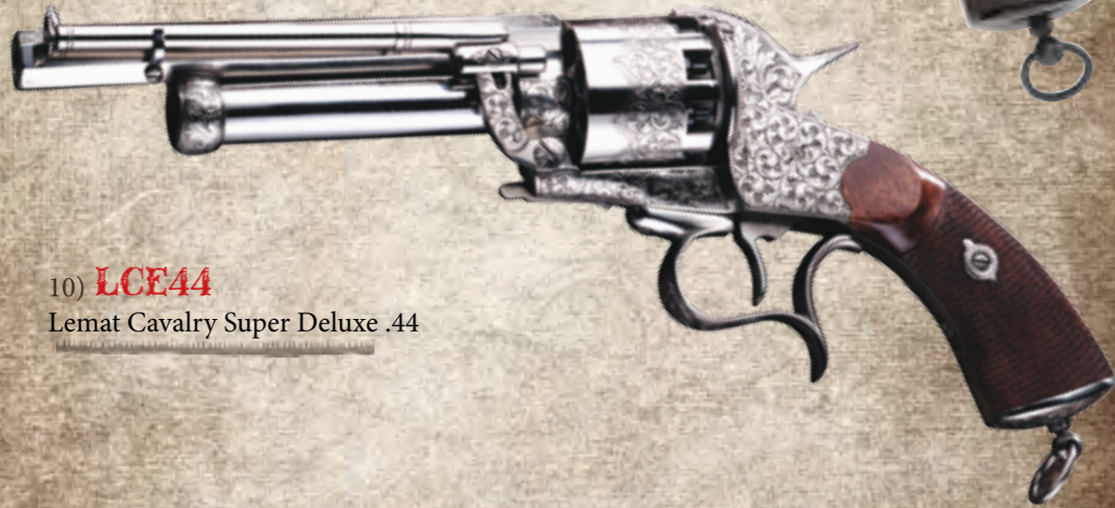
10) LCE44 Lemat Cavalry Super Deluxe .44