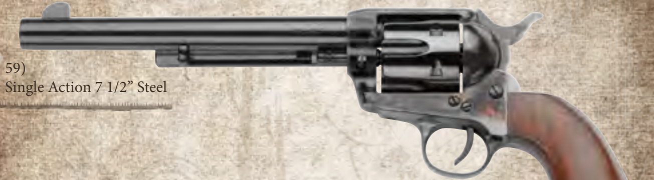
59) Single Action 7 1/2" Steel