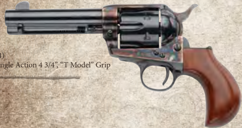
74) Single Action 4 3/4", "T Model" Grip