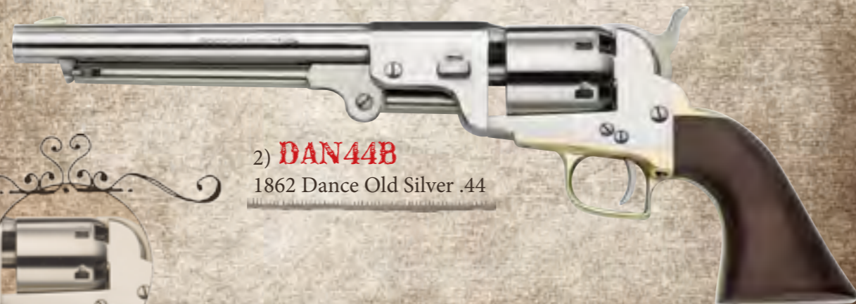
2) DAN44B 1862 Dance Old Silver .44