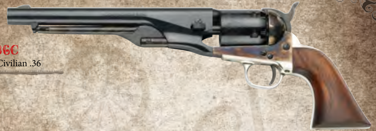
35) NAS36C 1861 Navy Civilian .36