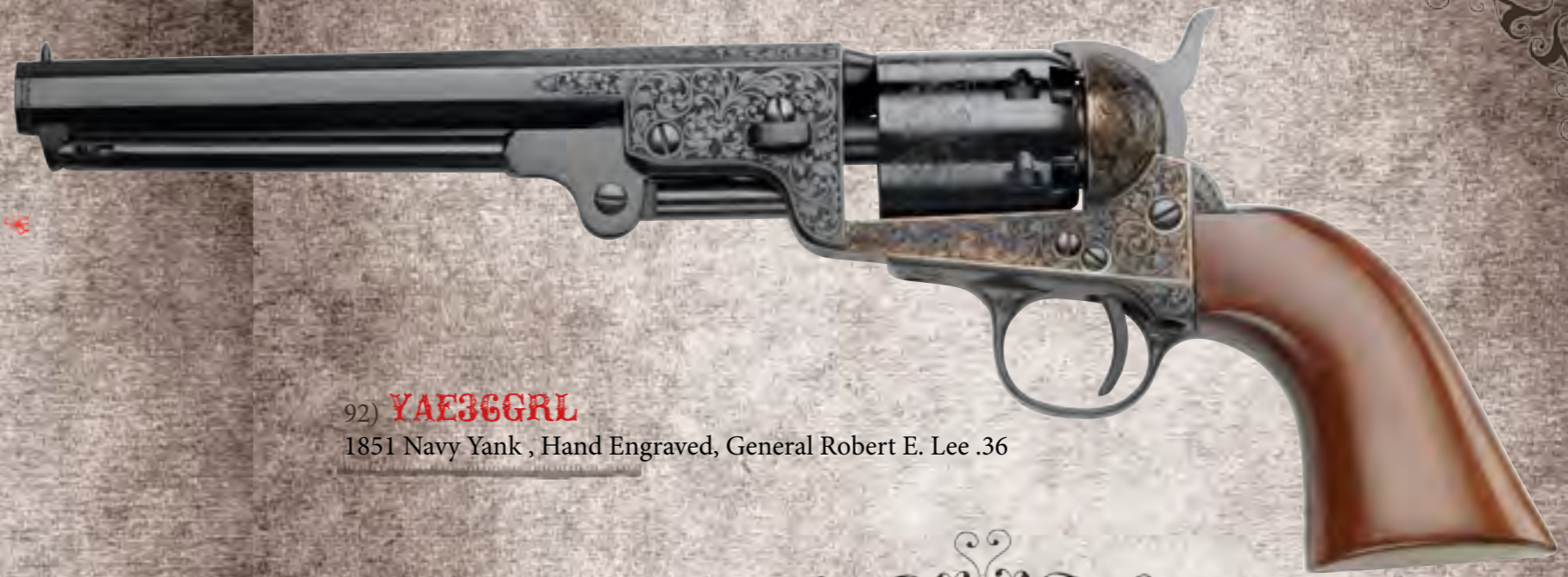
92) YAE36GRL 1851 Navy Yank , Hand Engraved, General Robert E. Lee .36