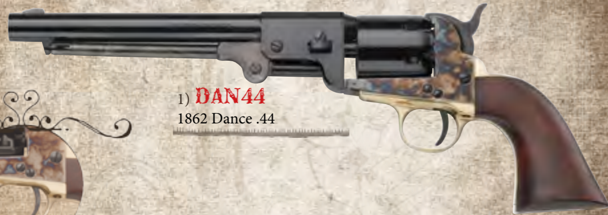
1) DAN44 1862 Dance .44