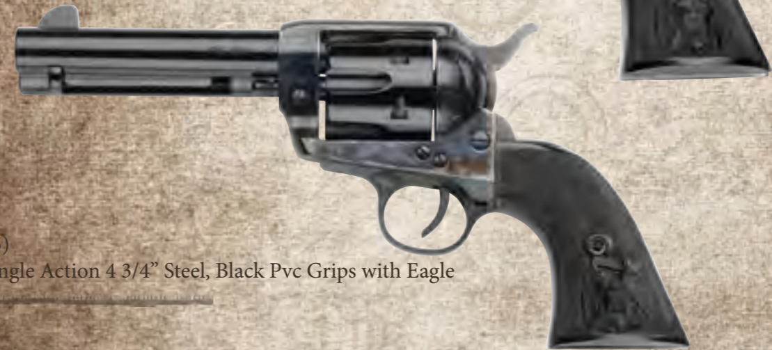
65) Single Action 4 3/4" Steel, Black Pvc Grips with Eagle