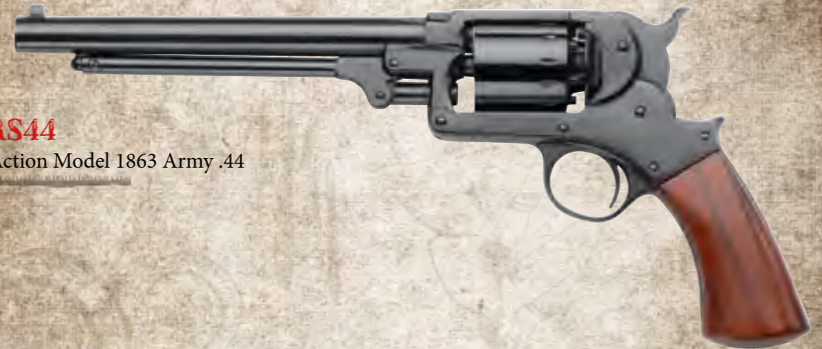
7) STARRS44 Starr Single Action Model 1863 Army .44