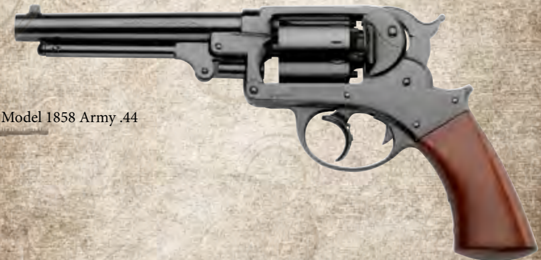
8) STARRD44 Starr Double Action Model 1858 Army .44