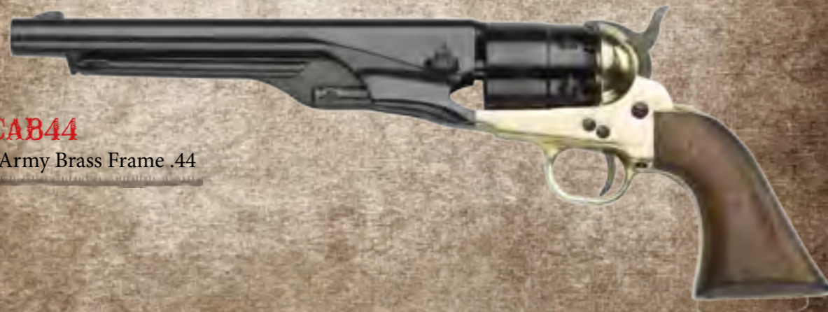
34) CAB44 1860 Army Brass Frame .44