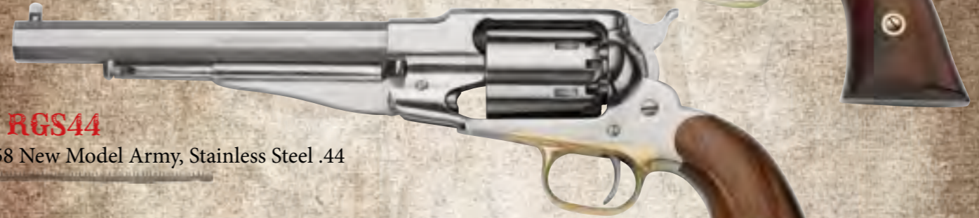
49) RGS44 1858 New Model Army, Stainless Steel .44