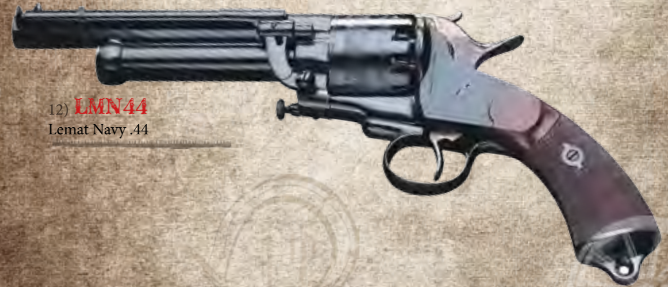
12) LMN44 Lemat Navy .44