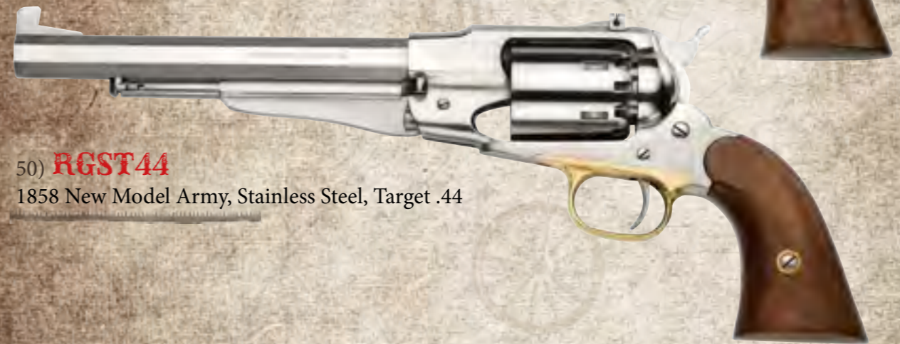
50) RGST44 1858 New Model Army, Stainless Steel, Target .44