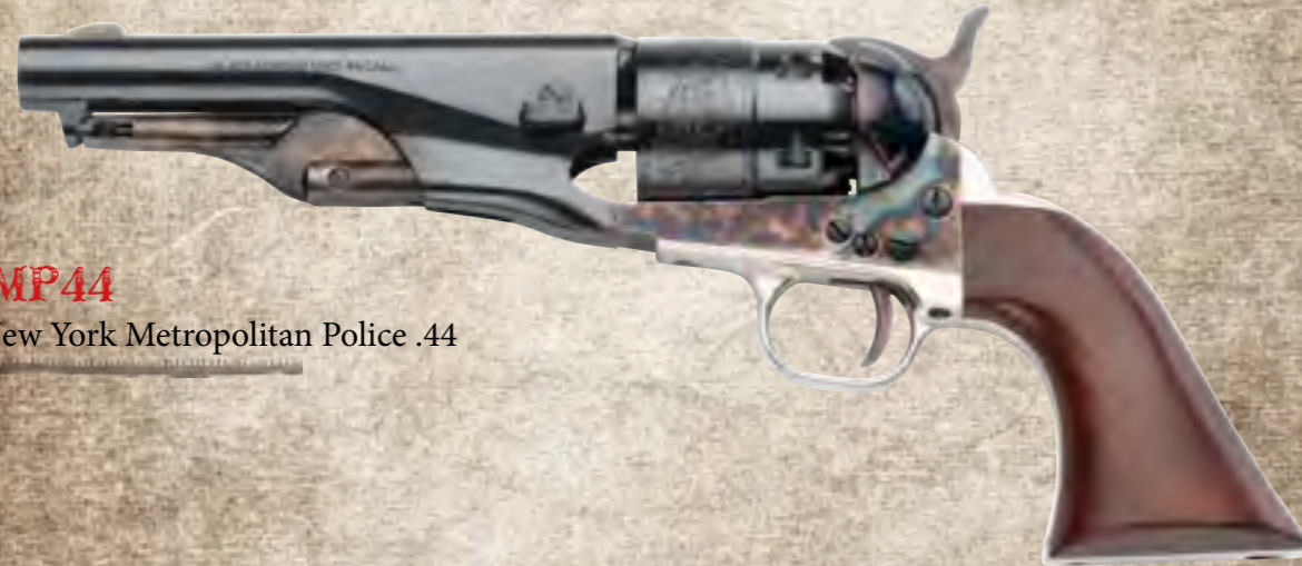
33) PMP44 1862 New York Metropolitan Police .44