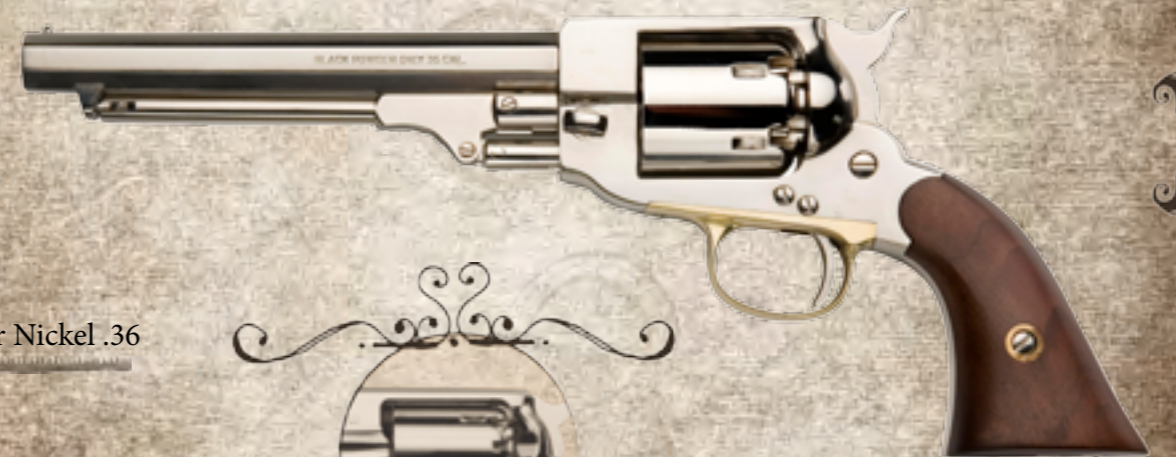
4) SPBN36 1862 Spiller&Burr Nickel .36