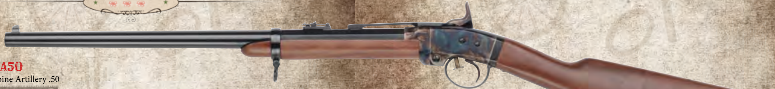
56) SMTA50 Smith Carbine Artillery .50