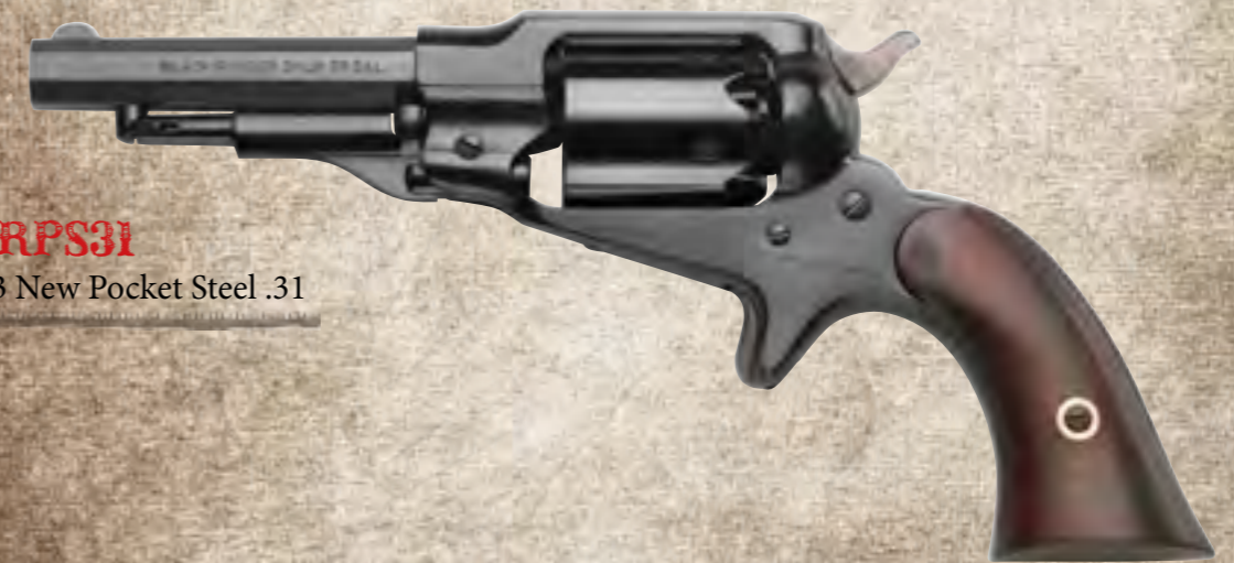
55) RPS31 1863 New Pocket Steel .31