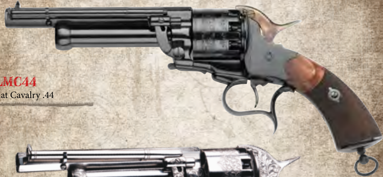
9) LMC44 Lemat Cavalry .44