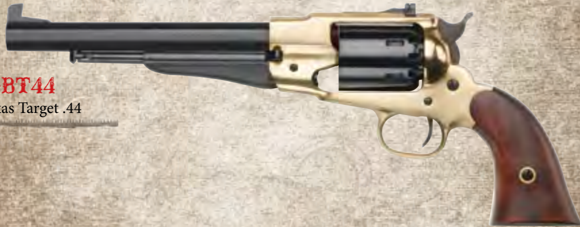
46) RGBT44 1858 Texas Target .44